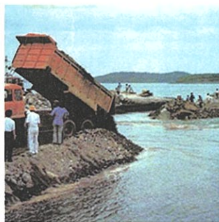
장도와 일도 사이 매립공사