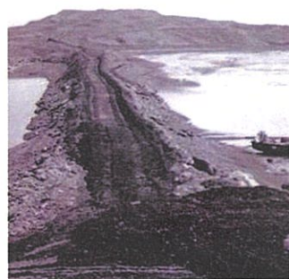
1960년대 섬과 섬을 잇는 청라지구 물막이 공사