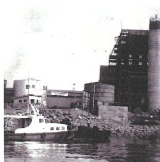
1970년 울도화력발전소 모습