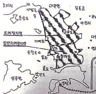
동아그룹이 작성한 김포간척지 그림