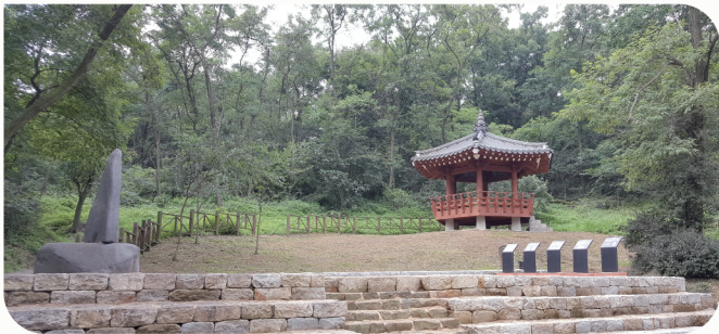
| 허암 정희량 유허지(시지정문화재 기념물 제58호)