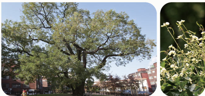
| 인천 신현동 회화나무(국가지정문화재 천연기념물 제315호)