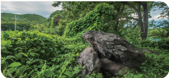
| 검단 대곡동 지석묘군(시지정문화재 기념물 제33호)