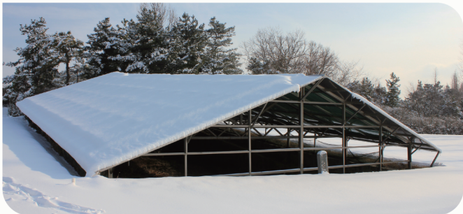
| 인천 경서동 녹청자 요지(국가지정문화재 사적 제211호)